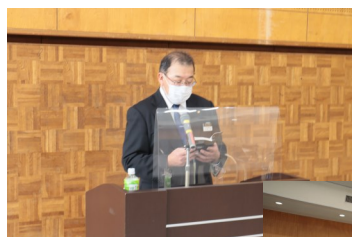
経営計画発表会 (1月)